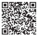
QRコード (社)日本気象協会

CHECK 1 川に出かけるときはまず、天気をチェック! 行き先には、大雨注意報・警報は出ていませんか?