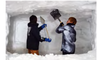
製作した学生たち