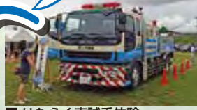
■はたらく車試乗体験