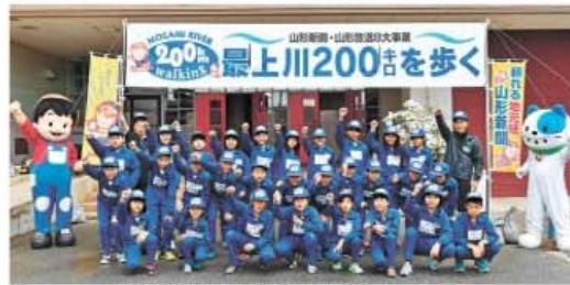
第3週を担当した長井市豊田小の4～6年生

「最上川200kmを歩く」の第3週は27日、長井市豊田小の4～6年生が担当した。洪水被害を軽減し生活用水も供給する長井ダムは巨大な守り、お城のようなまちなかを流れる小川の近くを散策し、水質検査も体験。きれいな最上川を維持していく重要性を肌で感じ取った。