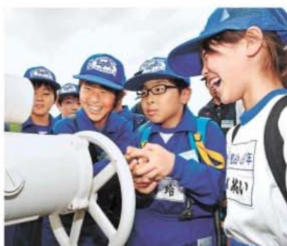
児童たちは笑顔を見せながら専門操作に挑戦した ＝長井市・南樋門

「おー高いー」。高さ100m・5.5m、県内で最も高い長井ダムの雄姿から見るはずなのに、子どもたちは驚きの声が上がった。続いて特別にエレベーターを使って、堤体の下部へ。「こんなに大きいです。見上げるダムのスケールに圧倒された様子だ。こんな巨大なダムがなぜ造られたのか。国土交通省長井ダム管理支所の担当者が、この日何度も聞くことになるキーワードを教えた。1967(昭和42)年の羽越水害。お城の長井ダムは洪水被害の軽減などを目的に建設された。機軸水としても使