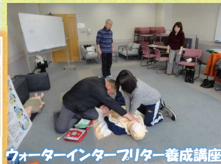
ウォーターインタープリター養成講座