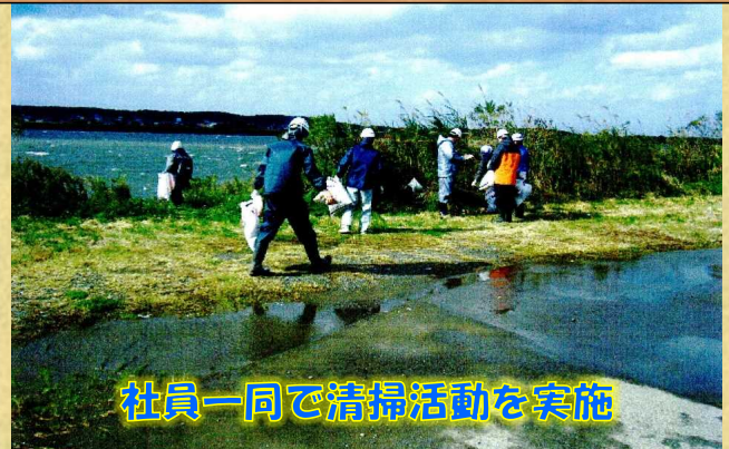
社員一同で清掃活動を実施