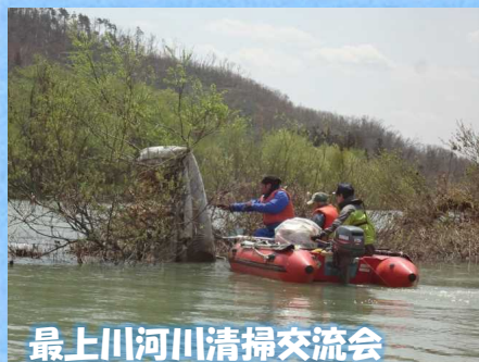
最上川河川清掃交流会

私たちは、最上川と沿川がもつ豊かな自然環境の保全活動や水源地域の豊かな自然環境を深く理解し、後世へ守り伝えていく人材の育成、活力ある地域社会の実現に向けた活動を行っています。