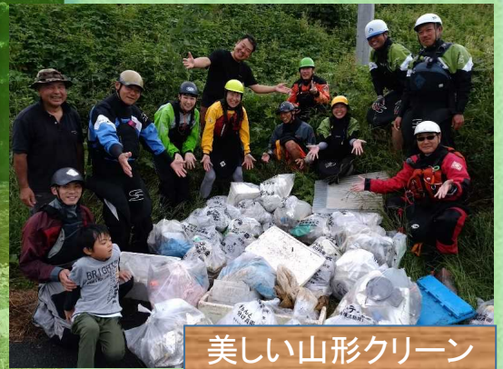
美しい山形クリーンアップキャンペーン