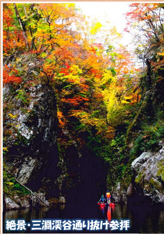
絶景・三淵溪谷通り抜け参拝