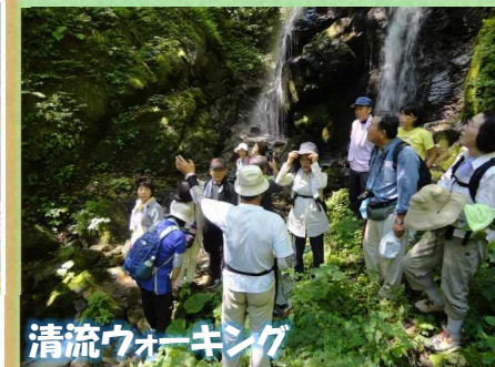
清流ウォーキング