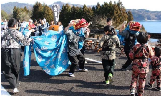
▲式典前 中須賀大神楽保存会の郷土芸能披露