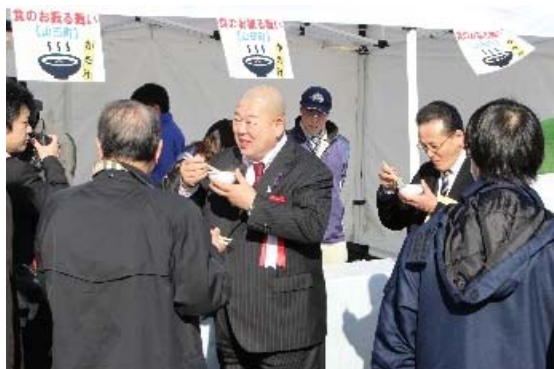
▲山田町からカキ汁のおふるまい