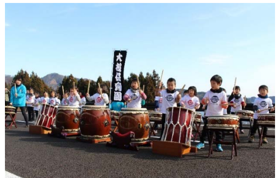
▲式典前 おおつち保育園の園児による太鼓演奏