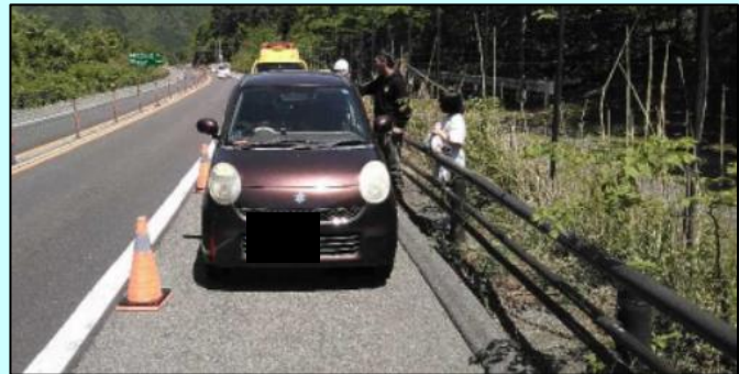
▲ ガードレール等の外側に避難