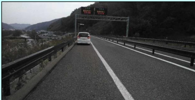
▲ 直線で見通しの良い場所

トンネルの中での事故や、火災などが発生した際は、非常駐車帯にある非常電話機からも通報が可能です。各電話機には「警察」、「消防」のボタンがあり、それぞれの機関に繋がります。