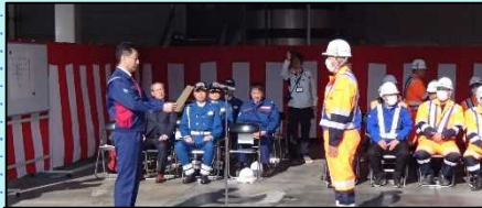
除雪従事者功労者表彰