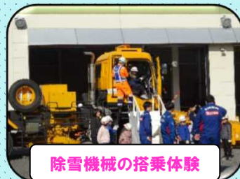
除雪機械の搭乗体験