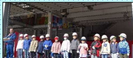
園児、児童による除雪機械出動の号令