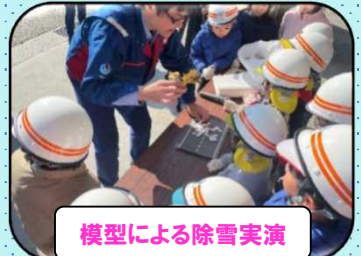
模型による除雪実演