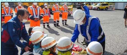
園児による除雪機械の鍵の引渡