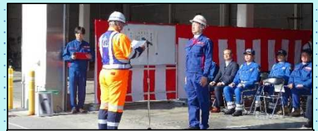
オペレーターによる安全宣言