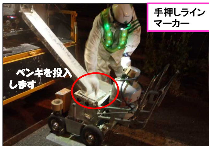
手押しライン マーカース