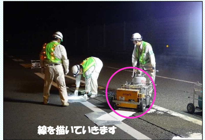
線を描いていきます