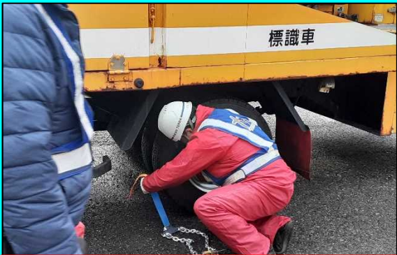
ワンタッチチェーンの装着訓練