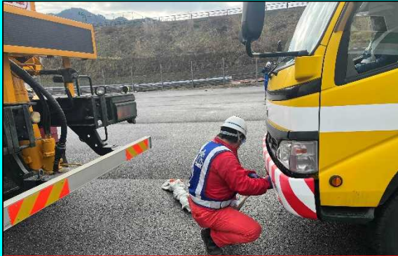
牽引ロープの取り付け

近年、全国的に大雪による大規模な車輛滞留(立ち往生)が発生し、物流と人流がストップし、社会経済活動に多大な影響を及ぼす事案が多発しています。そのため、立ち往生車輛を迅速に排除し、車輛滞留の早期解消を行うための牽引訓練や、緊急脱出用具の装着訓練を行いました。万が一立ち往生した場合や、車輛を発見した場合は、下記の道路緊急ダイヤルまでご連絡ください。