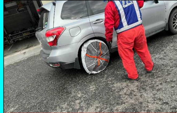
布製タイヤカバーの装着訓練