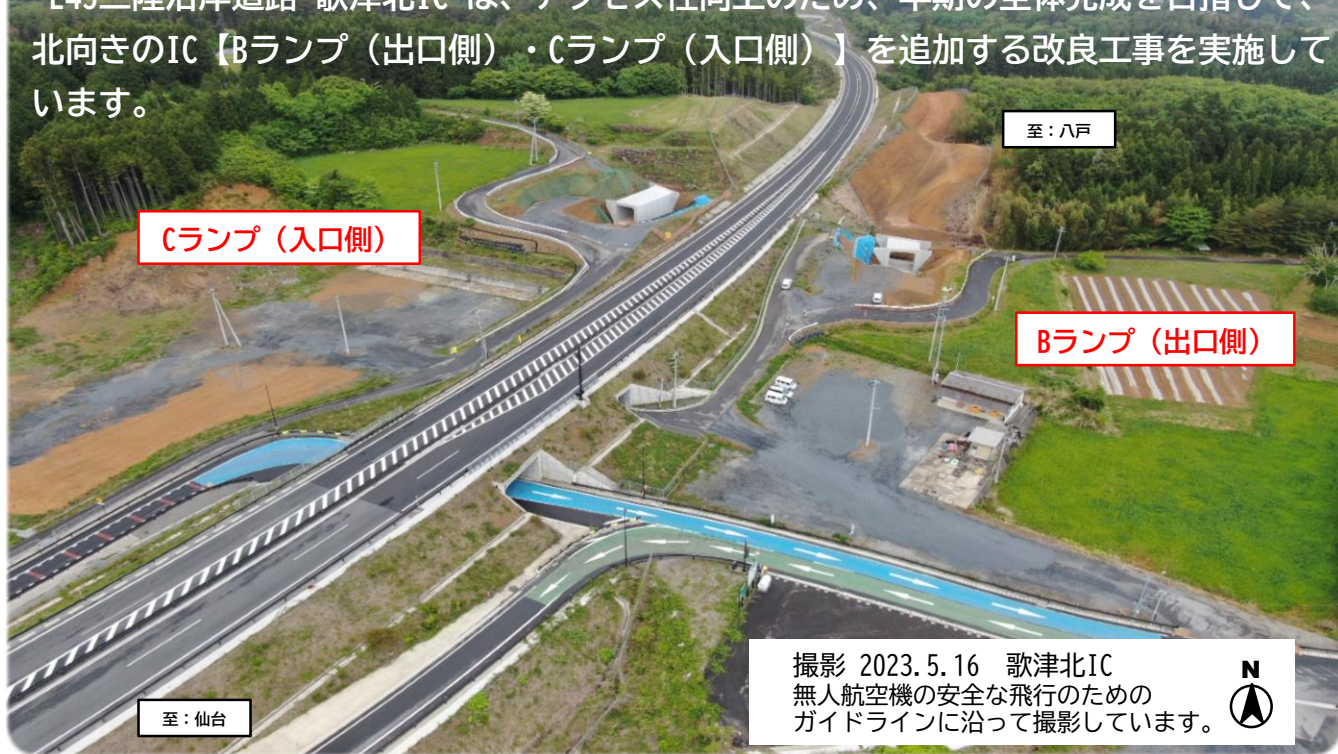
撮影 2023.5.16 歌津北IC 無人航空機の安全な飛行のための ガイドラインに沿って撮影しています。

E45三陸沿岸道路 歌津北IC は、アクセス性向上のため、早期の全体完成を目指して、北向きのIC【Bランプ（出口側）・Cランプ（入口側）】を追加する改良工事を実施しています。