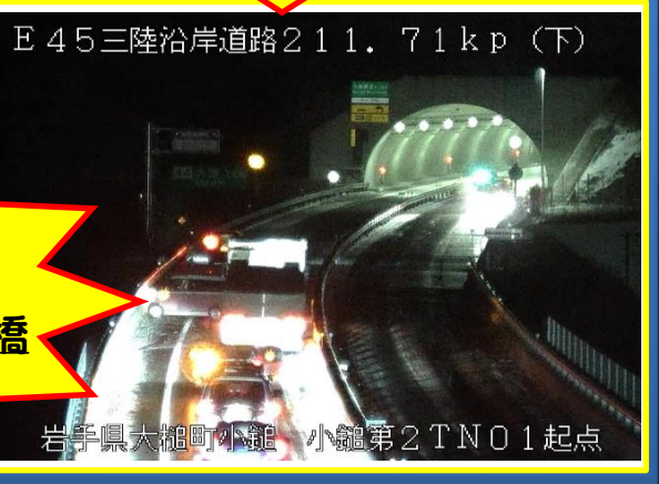
岩手県大槌町小槌 小槌第2 TNO1 起点