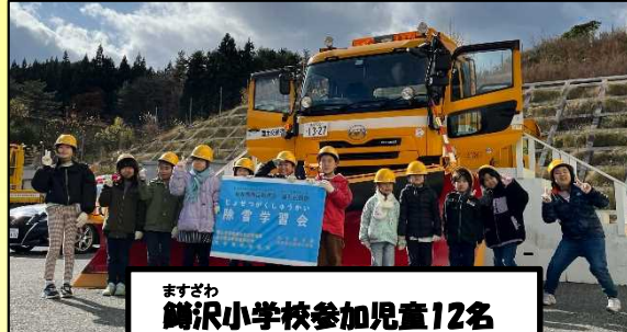
ますざわ 鱒沢小学校参加児童12名