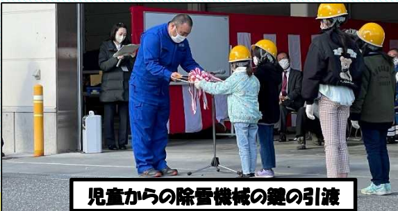
児童からの除雪機械の鍵の引渡