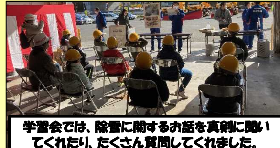
学習会では、除雪に関するお話を真剣に聞いてくれたり、たくさん質問してくれました。

11月16日(水)に、遠野市宮守町にある宮守防災除雪ステーションにて、 ますざわ 鱒沢小学校の応援を頂きながら、安全祈願式に引き続いて除雪機械出動式を行いました。子ども達の元気な姿や、力いっぱい の号令によって、釜石道の冬の準備が整いました。