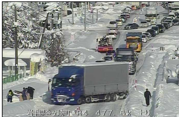
岩手県金ヶ崎町・R4 477.6k 上り