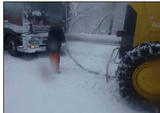
R1. 12. 27の大雪により立ち往生したトラックの牽引 (国道4号岩手県一戸町)