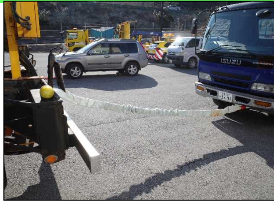
R3. 12. 24車両牽引実施訓練 場所(宮守防災除雪ステーション)