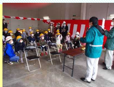
模型による除雪の実演