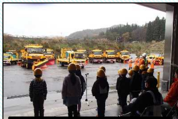
児童からの出動の号令