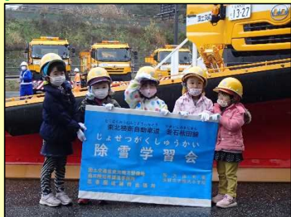
鱒沢保育園参加園児5人