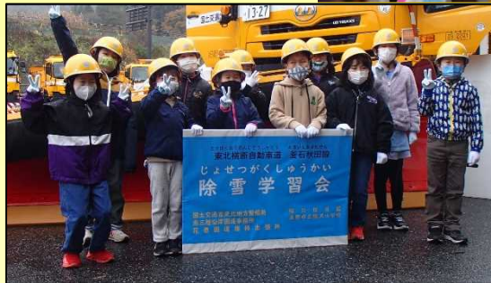
鱒沢小学校参加児童11人