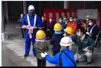
園児からの除雪機械の鍵の引渡