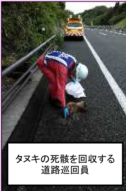
タヌキの死骸を回収する 道路巡回員