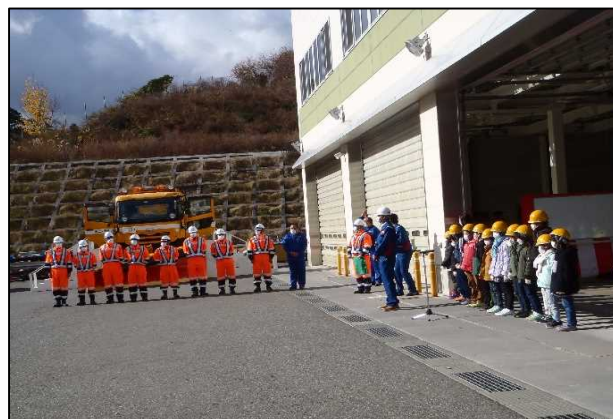
小学校児童による出発の号令