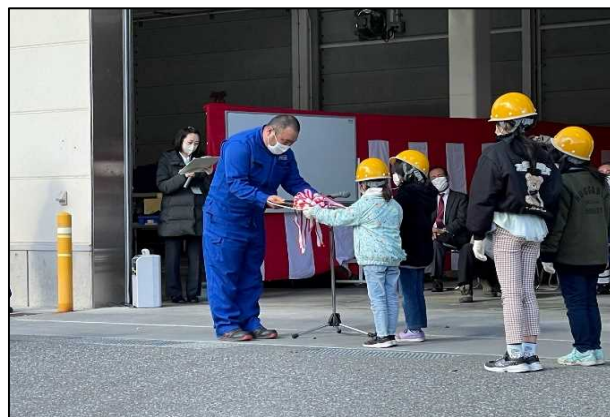
小学校児童によるキー引渡し