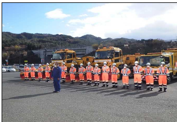
オペレーターによる安全宣言