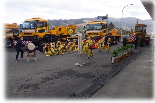
▲ 昨年度園児たちの演舞の様子 (へいたっこ虎舞: 平田こども園)