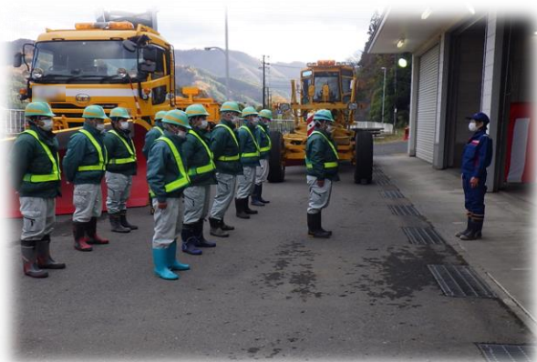
▲ 昨年度除雪機械出動式の様子