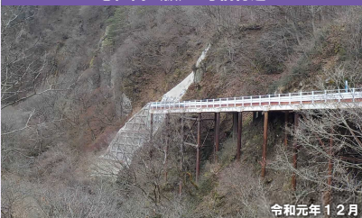
①区間 (仮) 2号橋付近