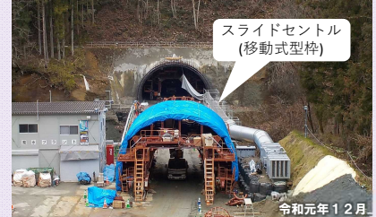
スライドセントル (移動式型枠)