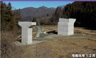
③区間 (仮) 5号橋付近