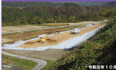
④区間 中妻地区付近