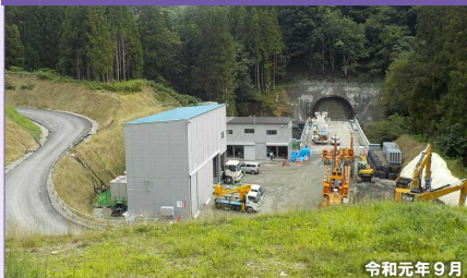
②区間 (仮)3号橋・3号トンネル起点側付近