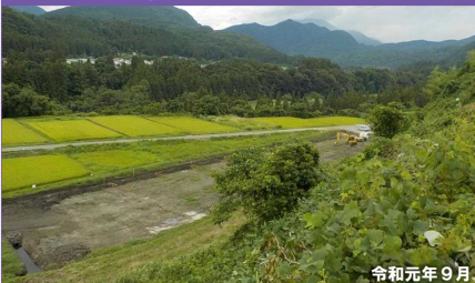
④区間 中妻地区付近