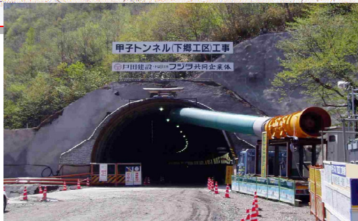
甲子トンネル下郷側坑口