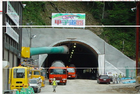
甲子トンネル西郷側坑口