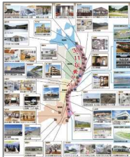
3.11伝承ロードの推進