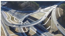
復興道路・復興支援道路の全線開通 （三陸沿岸道 釜石ICの様子）

○東日本大震災・原子力災害からの復興・再生 ・安全・安心で活力ある社会・生活基盤の構築