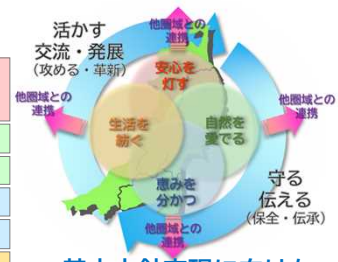
基本方針実現に向けた東北圏の回転軸