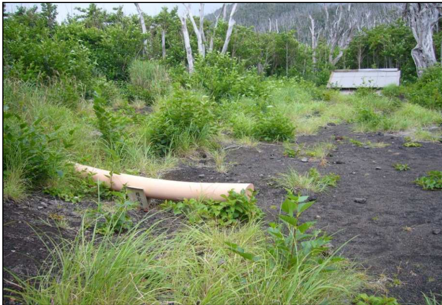
土石流で埋没した鳥居とお社