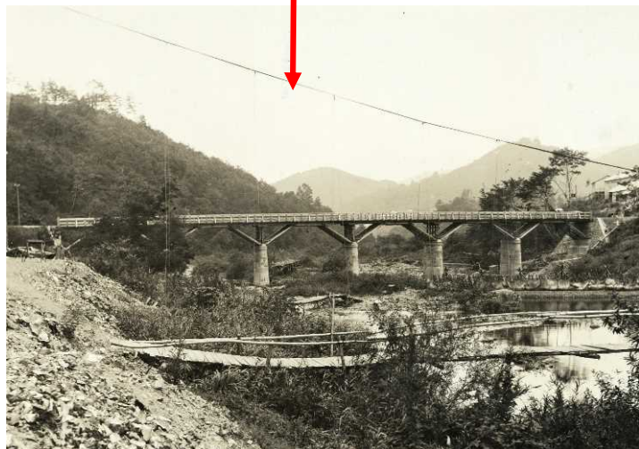
昭和17年9月 田瀬橋完成時