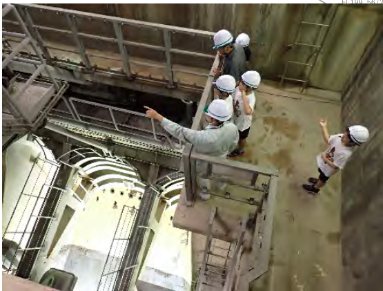
コンジットゲート室