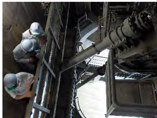
コンジットゲート室