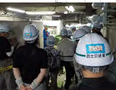
右岸監査廊入口 EL (220.00)