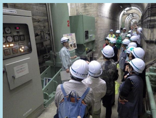
高圧放流設備見学