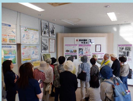
機械遺産特別展見学