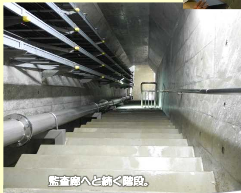
監査廊へと続く階段。