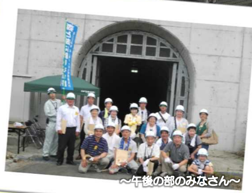
～午後部のみなさん～