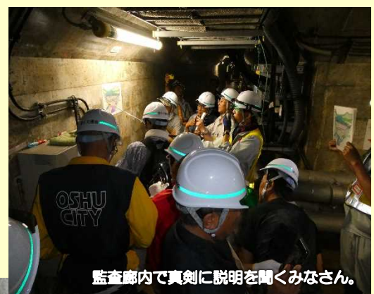
監査廊内で真剣に説明を聞くみなさん。