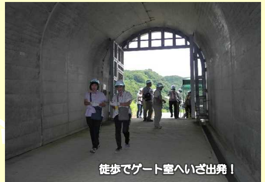
徒歩でゲート室へいざ出発！