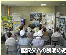
胆沢ダムの説明のあと...

☀️ もりみず旬間とは・・・より多くの方に森や湖、そして胆沢ダムへ親しみ・関心を持って頂くことを目的として、毎年7月頃に実施しています。