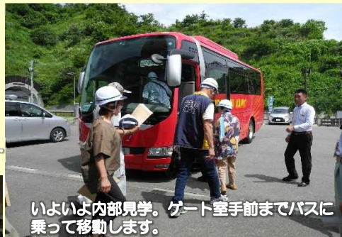
いよいよ内部見学。ゲート室手前までバスに乗って移動します。