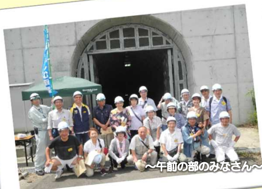
～午前部のみなさん～