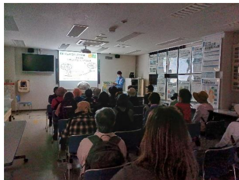
多くの質問もありました