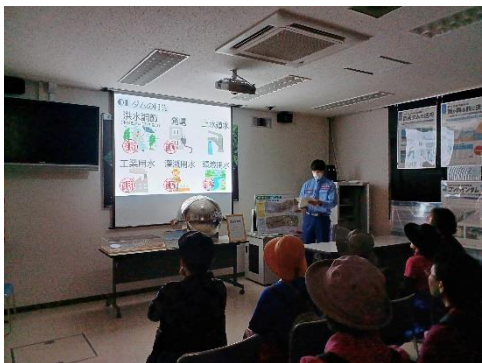
ものしり館での説明には興味深く聞き入っていただきました

ごしょこものしり館でダムの説明をした後は、監査廊のイルミネーションもご覧いただきました。