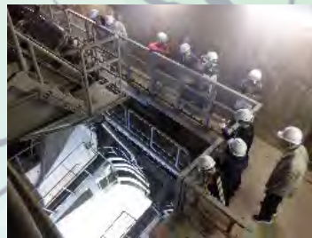
10月17日 ジパング大人の休日倶楽部様