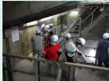
10月22日 湯沢団地みどり会様