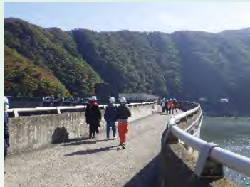
10月21日 ジパング大人の休日倶楽部様

さんまの竜田揚げ、なめこおろし、野菜の天ぷら、ブラウンスイス牛の有馬煮など。道の駅錦秋湖でお召し上がりください。