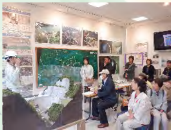
10月8日 和賀地区民生委員 児童委員協議会様