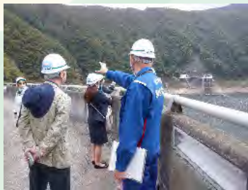
10月15日 ジパング大人の休日倶楽部様