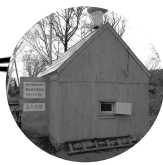
昭和35年の高下観測所