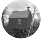
昭和35年の桐沢観測所