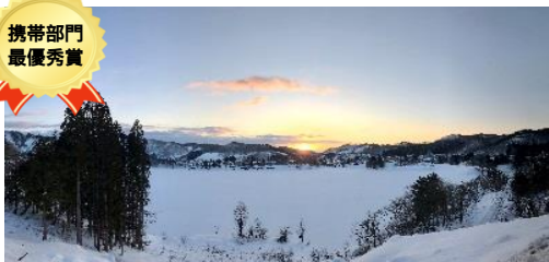
最優秀賞:川崎 詩織 タイトル:『冬の錦秋湖』