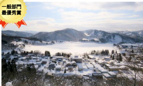
最優秀賞:小田島 学 タイトル:『ヘヴン』