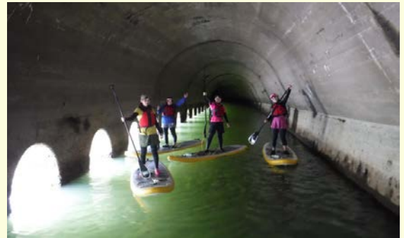
■旧国鉄横黒線の遺跡アドベンチャー【8月】 ※夏は「昭和へタイムスリップ！」 水上散歩で、昭和の時代を体感！