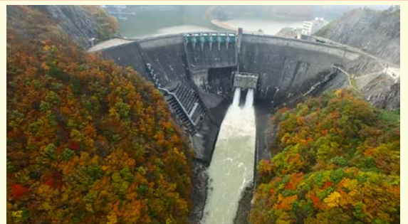
■錦秋湖フォト&空撮動画コンテスト【秋～冬】 ※ダム湖では全国初。ドローンによる景観撮影技術を競うコンテスト