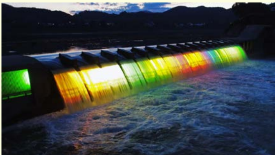
■錦秋湖大滝サマーLIGHTフェスティバル【7月】 ※感想例：すごくいい！船乗った。おもしろかった！ →来場者3,200人！