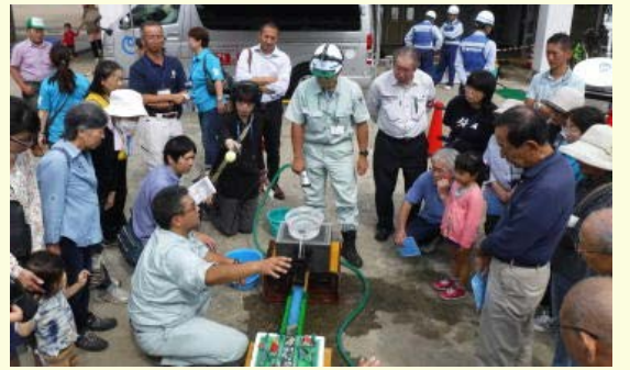
■ダム下流北上市住民と避難勧告・サイレン等実践的な水害に関する勉強会【9月】 ※感想例：ダムがあれば洪水が発生しないと思っていたが、異常な雨量の場合、ダムからそのままの量を流すことを知って驚いた