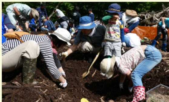
■流木に棲むカブトムシ採取会【5月】 ※親子連れに大人気！ カブトムシ育成講座も合わせて実施