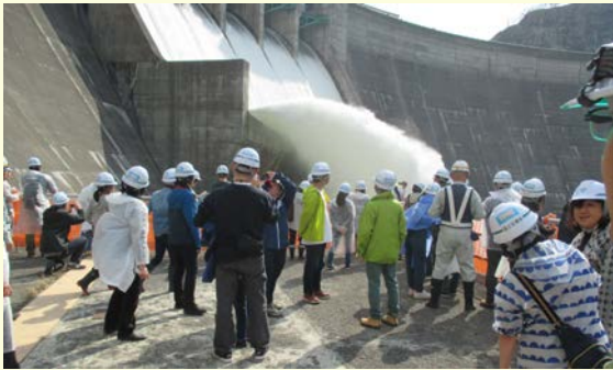
■錦秋湖スプリング放流【4月】 ※迫力ある放流を間近で体感！ →来場者2,800人！

新年明けましておめでとうございます。 昨年は、錦秋湖における様々な取り組みにご協力いただき、ありがとうございました。