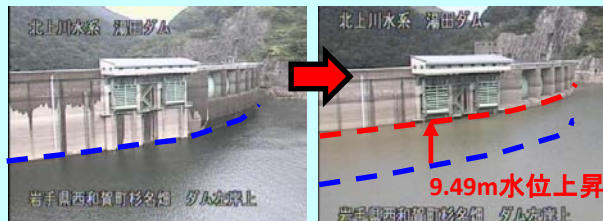
8月24日 16:00 (貯水位EL220.13m)

つい先月の末の話です。前線を伴う低気圧が日本海側から太平洋へ抜けた影響で、大気が非常に不安定な状態が続き、湯田ダム流域でも非常に強い雨が降りましたが、湯田ダムでは、 夏場あらかじめ水位を下げた容量 で、このような操作を行い、 下流の水位を低下させました 。これを「洪水調節」と呼びます。