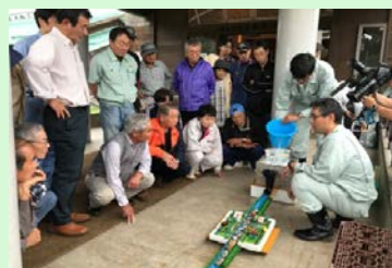
簡易模型による対話式の説明

当日は、ダムのサイレンを鳴らし、スピーカ放送で実践的な避難訓練が行われたほか、職員手作りのダム簡易模型を用い、ダムがあっても、貯められる量には限界があり、それを越えた大雨が降った場合は、ダムに入ってくる量と同じ量の水を流す。という現実をご理解いただき、速やかに安全な場所に避難する必要があることをご説明しました。