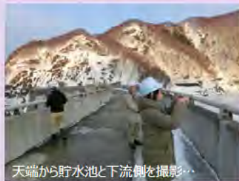
天端から貯水池と下流側を撮影...

はるばる関東圏から見学にいらした皆さん。カメラ片手に監査廊の中をじっくりと見学し、一つ一つの説明も興味深く聞いておられました。実は湯田ダムでは、一般の方が見学に訪れるのはたいへん久しぶりの事でした。楽しく見学いただけてよかったです！