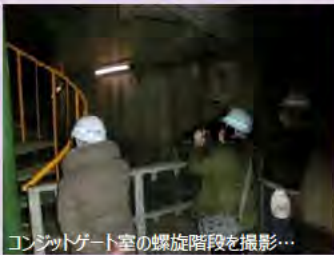
コンジットゲート室の螺旋階段を撮影...