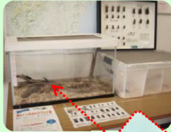
▲ものしり館内の様子