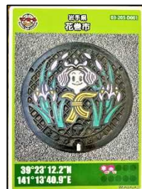
▲マンホールカード