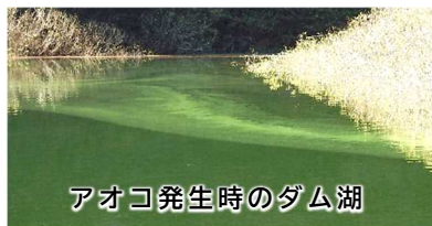
アオコ発生時のダム湖

6月1日(木)から曝気装置を稼働します。曝気装置で湖水を循環させることで、ダム湖の表面水温を低下させ「アオコ」の発生を抑制します。10月31日まで稼働を予定しています。