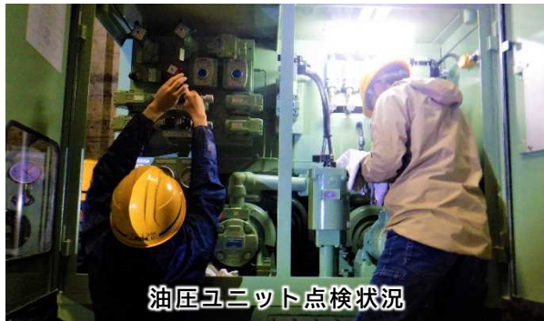
油圧ユニット点検状況

現在田瀬ダムでは、放流設備の点検を実施中です。年に一度専門業者により、動作確認やメンテナンスなどの詳細点検を行います。定期的な点検を行うことで、ゲート設備を健全な状態に保っています。