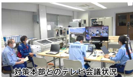
対策本部とのテレビ会議状況