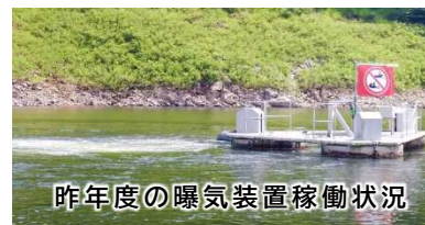
昨年度の曝気装置稼働状況