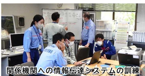
関係機関への情報伝達システムの訓練