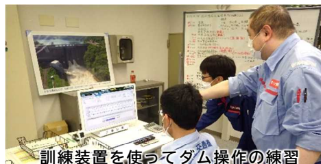
訓練装置を使ってダム操作の練習

5月12日(金)にこれからの出水期に備えて、洪水対応演習を実施しました。訓練装置や情報伝達システムなどを使用し、緊急時においても、確実に関係機関への情報発信やダム操作ができるよう訓練を行いました。6月7日(水)は、ダム放流にかかる警報操作やゲート操作などの一連の実践的な訓練も行う予定です。