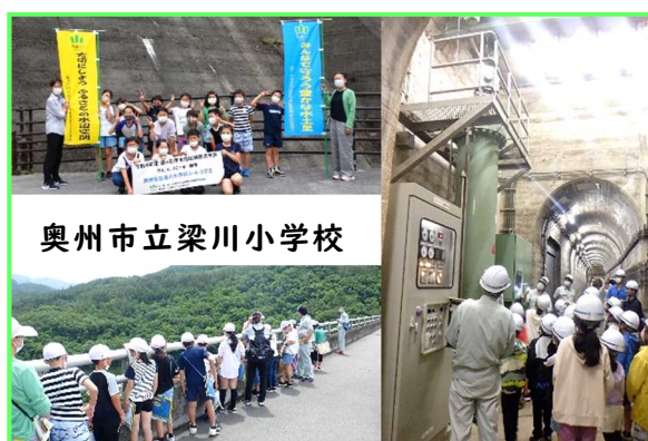
奥州市立梁川小学校