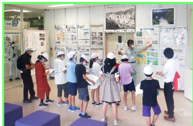
奥州市立 広瀬小学校