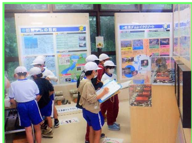
奥州市立稲瀬小学校