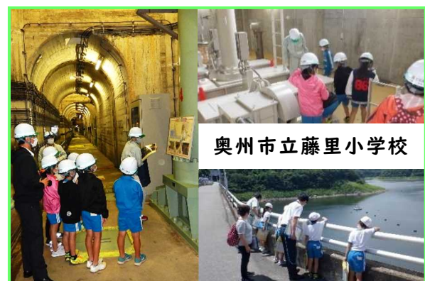
奥州市立藤里小学校