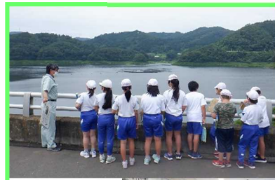
北上市立 黒岩小学校