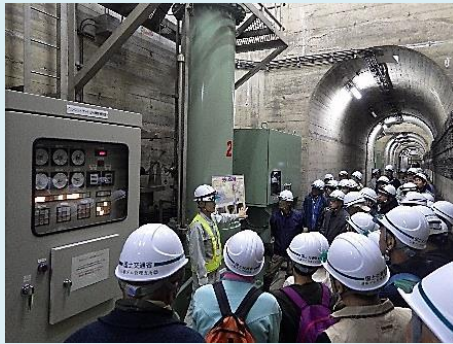
ダム内部の高圧放流設備見学