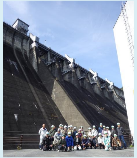
田瀬ダムと記念撮影