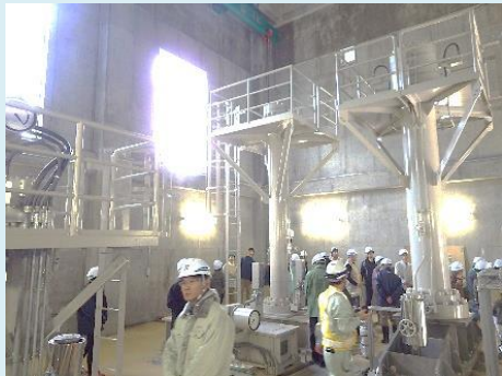
常用放流設備見学

花巻市民限定企画の田瀬ダム高圧放流設備特別見学会を10月24日(木)に開催しました。機械遺産に認定された機械設備やダムについて、2時間たっぷりと見学しました。高圧放流設備の実物展示やダム内部の見学では、皆さん食い入るように見ていました。なお、機械遺産の特別展(3月末まで)と高圧放流設備の実物展示については田瀬ダムにお越しただけであれば自由に見学が出来ます！(ただし、実物展示は冬期の降雪状況により見学出来ない場合があります)また、4月以降には一般の方を対象にした「高圧放流設備特別見学会」も開催する予定です。詳細は後日お知らせします。