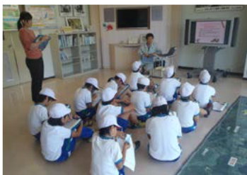
ものしり館での説明

ものしり館でダムの役割の説明のあと、操作室・監査廊を見学しました。当日はとても暑かったのですが、監査廊の中の涼しさにとても喜んでいました。