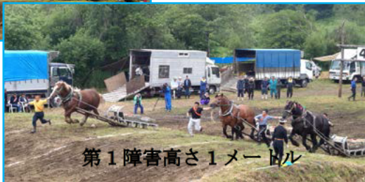
第1障害高さ1メートル