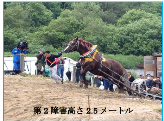
第2障害高さ2.5メートル