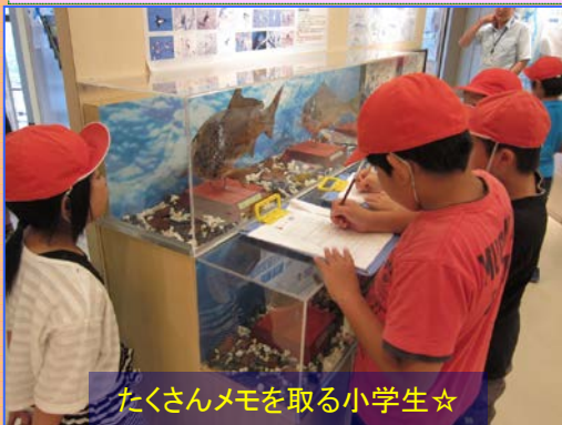
たくさんメモを取る小学生☆

8月も、たくさんの小学生や高校生の皆さんが見学にいらしてくださいました。 東京の早稲田実業高等部の7名は、岩手県を研究テーマとして「岩手教室」を計画し、 見学にいらっしやいました。