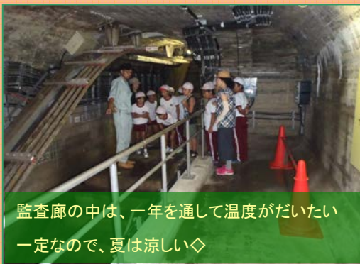
監査廊の中は、一年を通して温度がだいたい一定なので、夏は涼しい◇