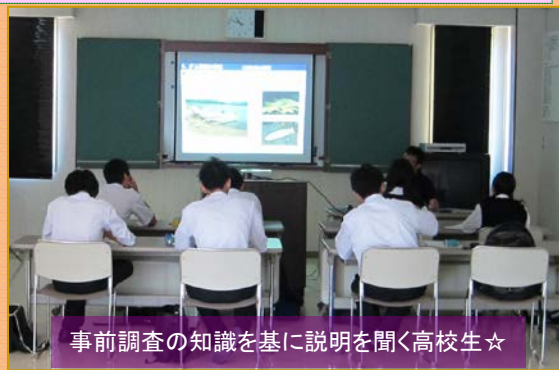
事前調査の知識を基に説明を聞く高校生☆