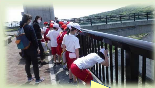
洪水吐きをのぞき込む児童。