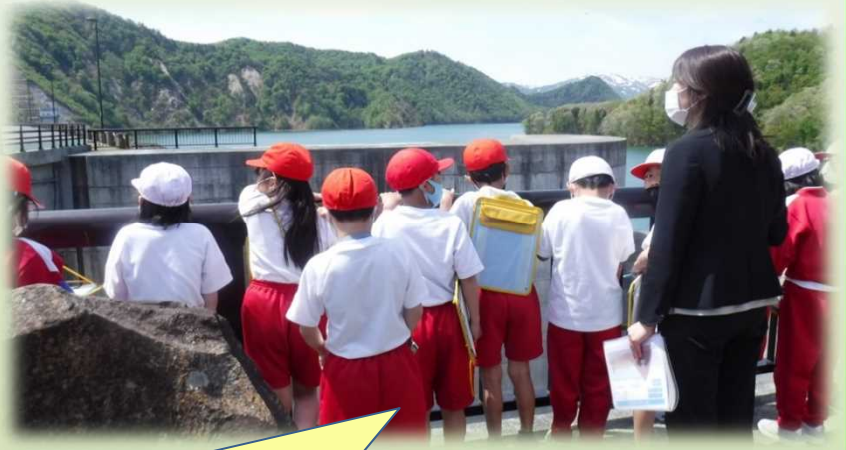
案内スタッフの話を聞く児童。北上川ダム統合管理事務所のHPにも見学だよりがありますのでご覧ください!