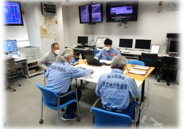
参加者全員で情報を共有