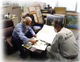
異常洪水の予測を通報中 防災エキスパートとの情報交換