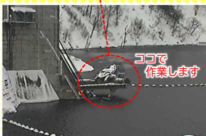
ココで作業します

月に一度、ダム湖から採水をして水質を確認しています。採水場所はダム湖2か所、河川5か所です。ダム湖での採水は通常ボートを使用して行います。