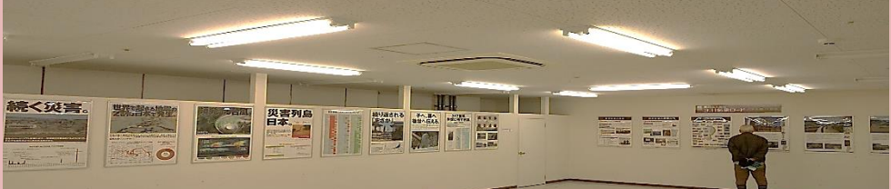
奥州市メイプル2F開催時の様子 (開催期間:令和2年12月21日(日)~27日(日))

「3.11伝承ロード」とは、東日本大震災の教訓を学びながら、これまでの防災に対する知識や意識を向上させ、地域や国境を越えた多くの人々との交流を促進させ、災害に強い社会の形成と地域の活性化に貢献することを目的としています。詳しくは ホームページ をご覧ください。 3.11伝承ロード で検索!