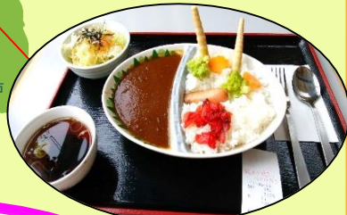
浅瀬石川ダムカレー (道の駅虹の湖)