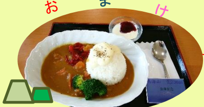
※鳥海山カレー(花立クリーンハイツ) ◆山形県と秋田県に跨がる標高2,236mの活火山。