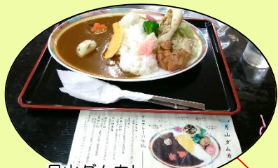
月山ダムカレー (米の粉の滝ドライブイン)