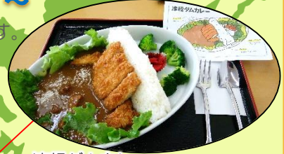
津軽ダムカレー (道の駅津軽白神ビーチにしめや)