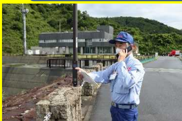
◆119番通報している様子◆