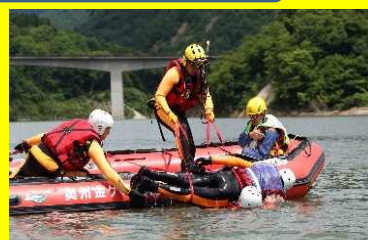
◆要救助者をボートに引き上げる瞬間◆