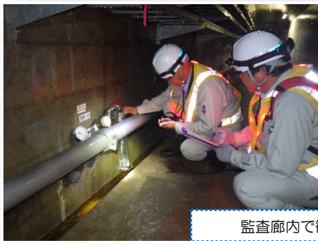
監査廊内で観測している様子