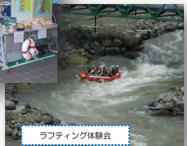
ラフティング体験会