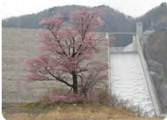
堤体下流の一本桜と放流の様子

もうすぐ春、桜の季節ですね～♪胆沢ダムでは例年4月下旬頃から6月上旬にかけて、雪解け水がダムから自然に流れ出します。また、ダム堤体下流では放流しているダムを背景に、美しく咲き誇る一本桜を見ることができます。※雪解けの状況、桜の開花状況により、日程が前後する場合がございます。 昨年の様子をご紹介します。