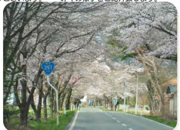
国道397号の桜回廊の様子