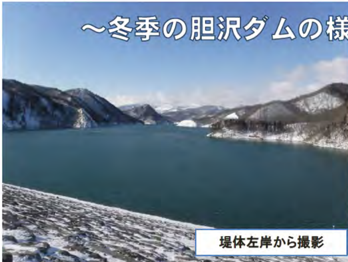
堤体左岸から撮影