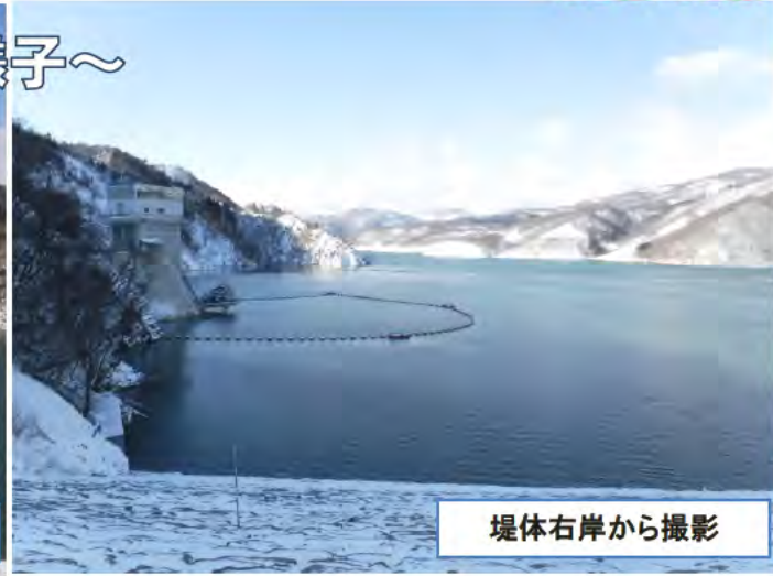
堤体右岸から撮影

右のグラフは、胆沢ダム管理支所付近の積雪量を表したものです。青は過去の平均、緑は昨年、赤は今年の積雪の値となっています。グラフからも分かるように、例年より積雪は少なめですが、貯水池の水位は平年並みとなっています。