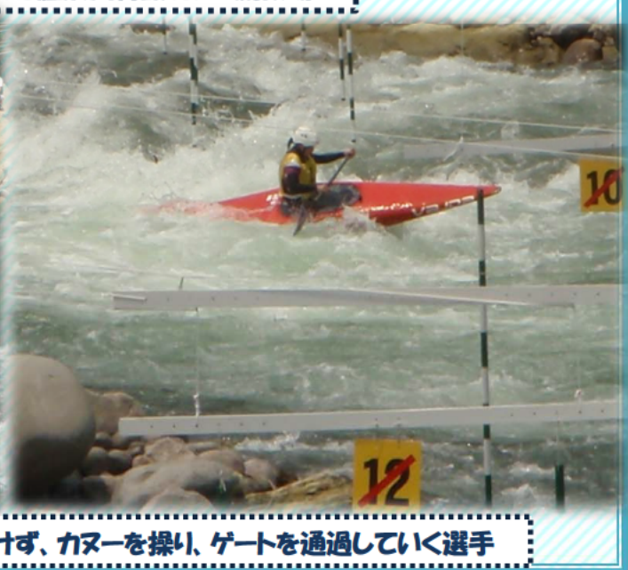
急流に負けず、カヌーを操り、ゲートを通り抜けていく選手