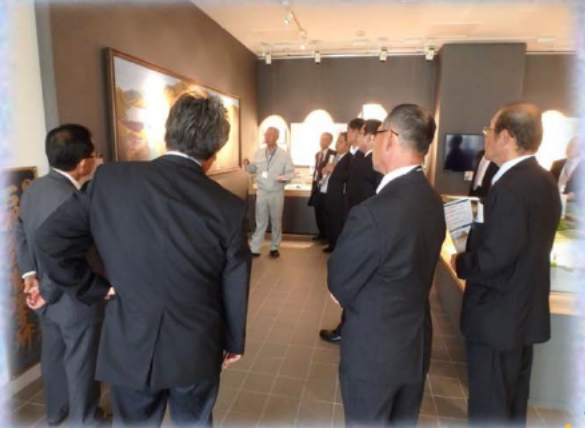
6/17ながめま土地改良区の皆様 18名