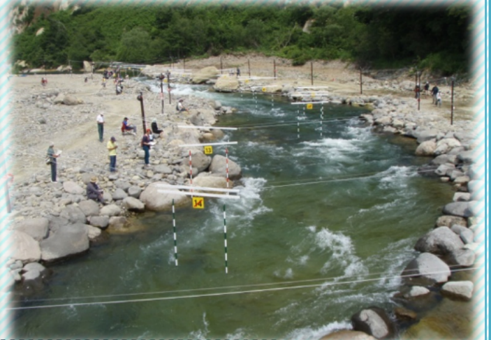
胆沢ダム下流に整備された胆沢川特設カヌー競技場