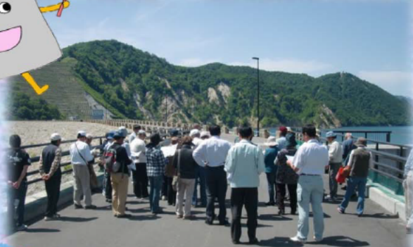
6/1 奥州市水道部（一般市民の皆様）